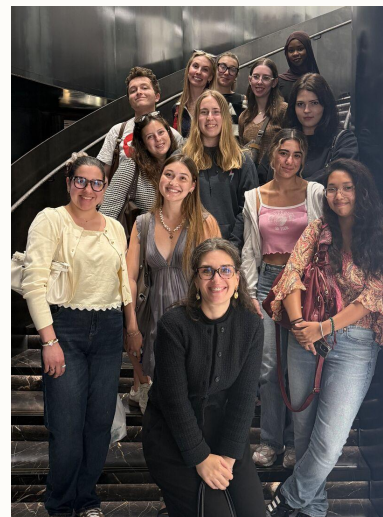
Visite pédagogique de la Maison Moncler avec 15 universitaires américains venus à Paris pour suivre le cours d’été “ Fashion & Business in France ” que j’ai entièrement construit et animé pour l’institut CIEE.